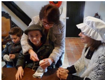
sokken stoppen en